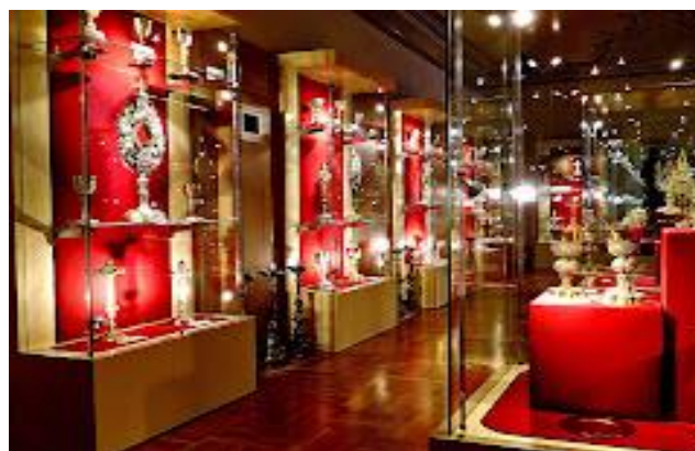
Szent Bertalan kincstár