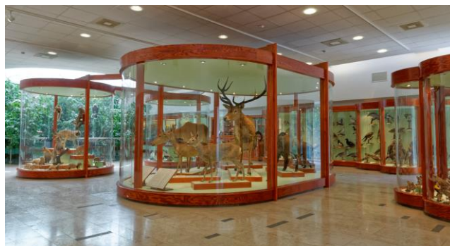
Kiállítás a Mátra Múzeumban